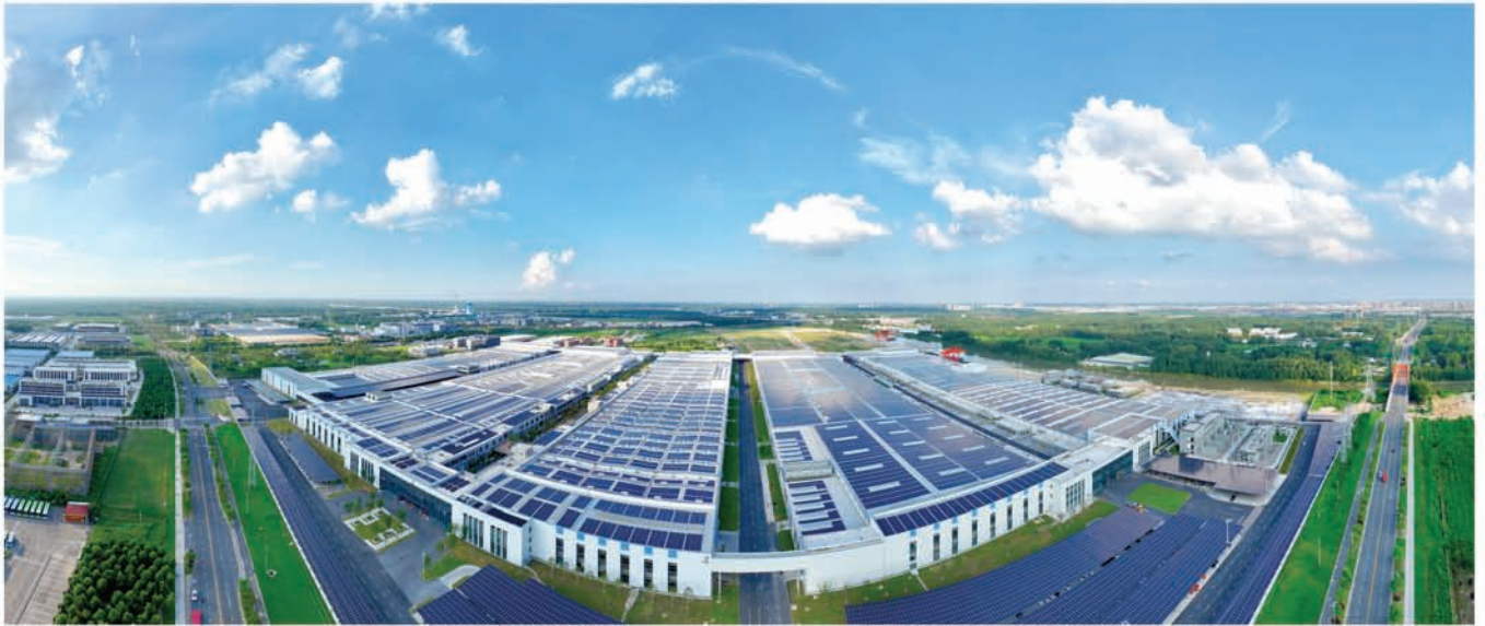
人大代表经济运行观察点——中天钢铁（淮安）新材料有限公司