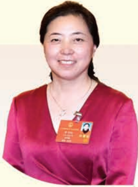
李叶红 全国人大代表 盱眙石马山生态农业综合开发有限公司总经理

春风拂面，万象更新。在全国两会即将召开、三八国际妇女节来临之际，我们特别邀请了五位来自全国及省市的人大女代表，聆听她们的新年新希望。她们是母亲、是妻子、是女儿，更是人民的代言人——从乡村振兴到科技创新，从万家灯火到家国期盼，她们用温柔而坚定的声音传递基层脉搏，以细腻的笔触描绘民生图景。愿这些“她声音”如春风化雨，汇聚成奋进的春之序曲，在推进中国式现代化淮安新实践的征程中绽放灼灼芳华。